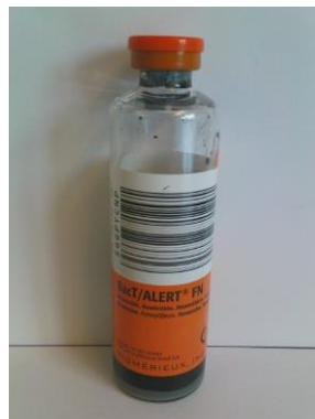
Blutkulturflasche, anaerob (Biomérieux BacT/ALERT FN Anaerobic)