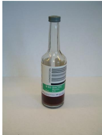
Pilz-Flasche (BD Bactec Mycosis IC/F)