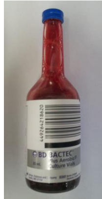
Aerobe-Flasche (BD Bactec Plus Aerobic/F)