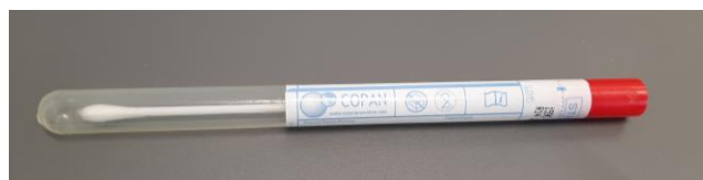
PST-Abstrich ohne Transportmedium