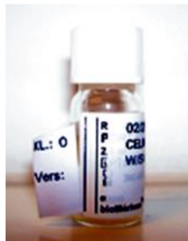
Biopsie in Port-Pyl ( Helicobacter pylori )