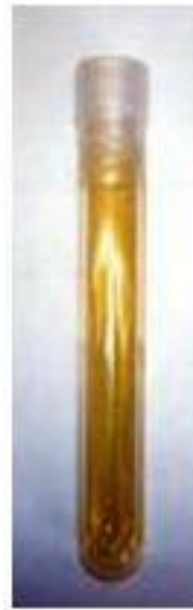
Serum in sterilem Gefäß