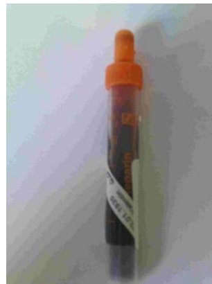
Blut mit Lithium-Heparin Lagerung bei Raumtemperatur