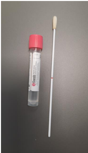
E-swab Abstrich mit flüssigem Transportmedium