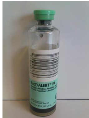
Blutkulturflasche, aerob (Biomérieux BacT/ALERT FA Aerobic)