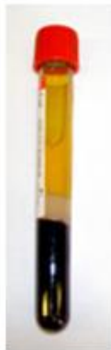
Serum in Serumentrennröhrchen