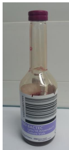
Anaerobe-Flasche (BD Bactec Lytic/10 Anaerobic /F)