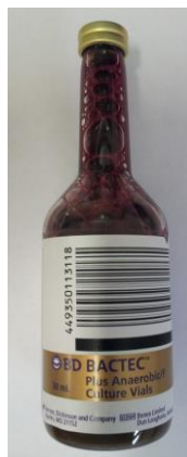
Anaerobe-Flasche (BD Bactec Plus Anaerobic /F)