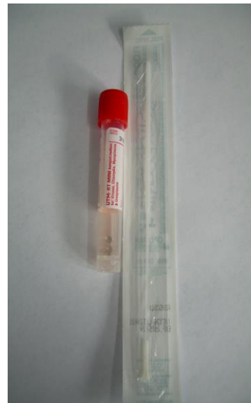
AS-Copan UTM Kit, Virus, Chlamydia, Mycoplasma u. Ureaplasma