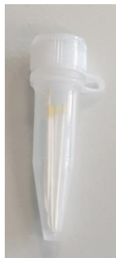
Papierspitze in sterilem Gefäß (parodontopathogene Markerkeime)