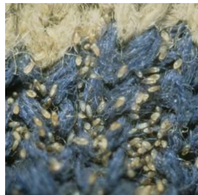
Abb: 3 und 4